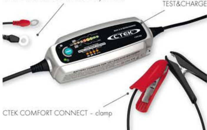
CTEK COMFORT CONNECT - clamp