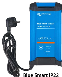
Blue Smart IP22 12/30 (3)